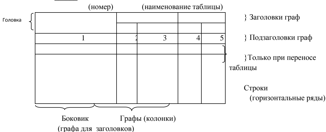
Рисунок 2 - Оформление таблицы

При переносе части таблицы на другой лист слово «Таблица 1», ее номер и наименование указывают один раз слева над первой частью таблицы, а над другими частями также слева пишут слова «Продолжение таблицы 1» и указывают номер таблицы.