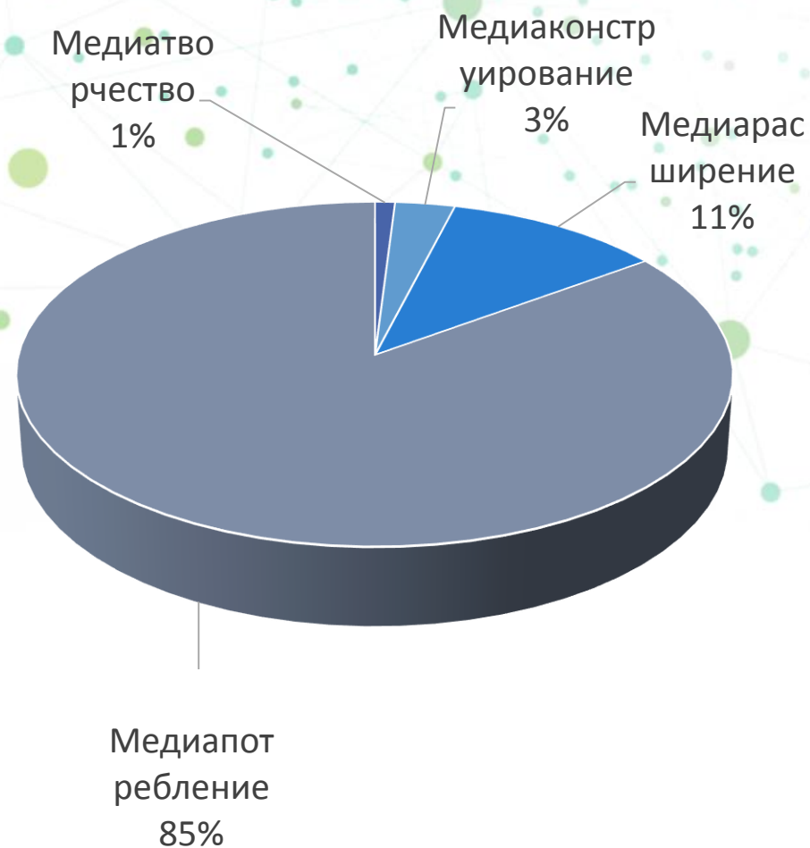
Уровень медиакомпетентности 2016 год

Информационный сайт колледжа содержал устаревшие, и потому неактуальные медиатексты. Ссылки на персональные страницы преподавателей и студенческих групп колледжа вовсе отсутствовали, а соответственно не в полной мере функционировало сетевое взаимодействие субъектов пространства. Только единицы из числа преподавателей состояли в профессиональных сетевых сообществах. Те, что предпринимали попытки шагать в ногу со временем и стремились использовать привычные для студенческой аудитории сервисы, сталкивались с проблемой незнания всего арсенала возможностей современных медиа и неумения выполнять собственные обучающие медиаресурсы и т.п.