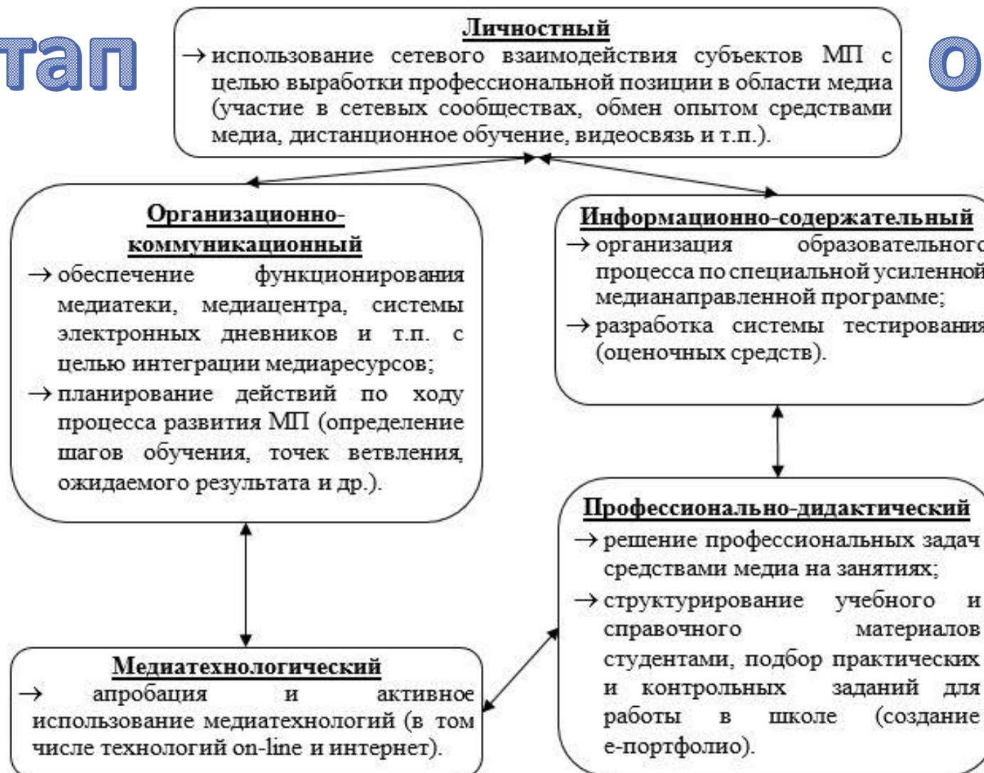
Организационно-содержательная карта II этапа развития педагогически ориентированного медиaprостранства ПОО